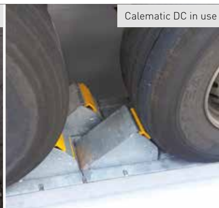
Calematic DC in use