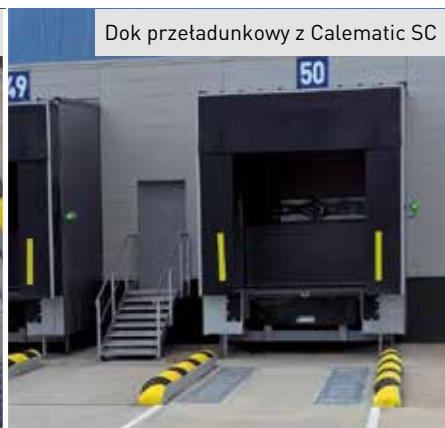
Dok przetadunkowy z Calematic SC