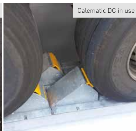
Calematic DC in use