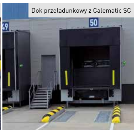
Dok przetadunkowy z Calematic SC